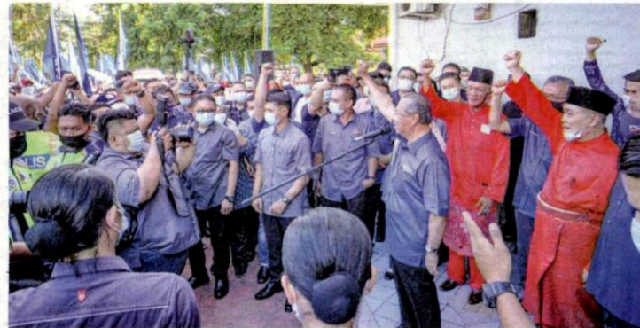
KEMENANGAN calon Perikatan Nasional (PN) pada Pilihan Raya Negeri Sabah tahun lalu iaitu 17 daripada 29 kerusi mengatasi peratus kemenangan calon Barisan Nasional (BN).

Komitmen PN kepada penyatuan ummah dan perpaduan nasional pula terserlah bila Mesyuarat MT PN pada 1 Disember 2020 bersetuju mencadangkan pembentukan sebuah Majlis Presiden yang dianggotai oleh