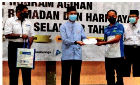
Anhar (tiga dari kanan) menyerahkan bantuan zakat kepada salah seorang penerima pada Program Bantuan Ramadan dan Hari Raya LZS 2021 di Dewan Serbaguna MPSJ Taman Puchong Utama di sini pada Isnin.

Kenyataan LZS memberitahu, daerah Klang mencatatkan