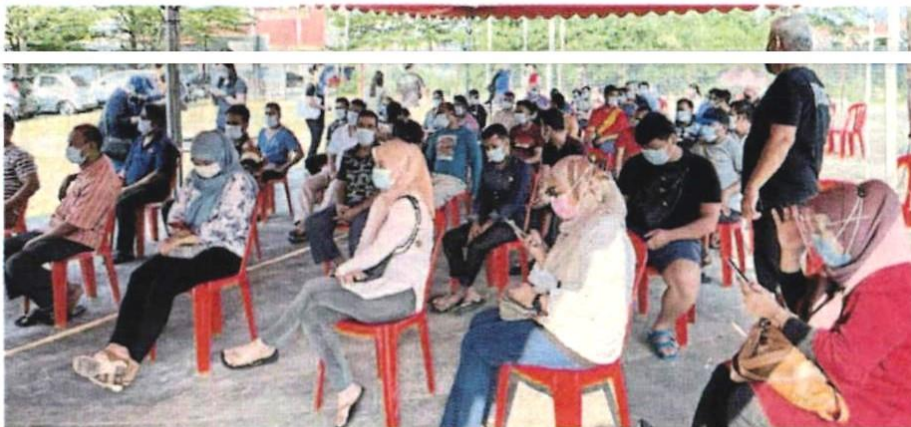
■无拉港州选区第3场社区筛检反应不如预期，只有306人响应。

她说，如果检测结果呈阳性，就必须根据卫生部的安排再做一次聚合酶链反应 (RT-PCR)。