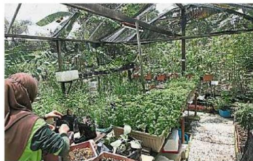
安邦淡江AU2组屋迷你图书馆就建立在组屋的社区菜园内。

他补充,该组屋被称为哥伦比亚组屋(Flat Colombia),在9.4英亩中就有高达2300名以上的住户,他们一直都在努力地改善附近的环境,包括通过教育改善居民卫生意识,所以组屋附近的巴生河段已不再充满垃圾;当然他们也设