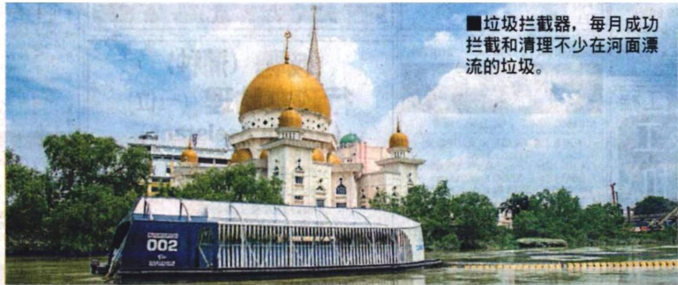
■垃圾拦截器，每月成功拦截和清理不少在河面漂流的垃圾。

(巴生12日讯)英国天团酷玩乐队(Coldplay)赞助海洋垃圾拦截器，协助清理大马的“垃圾河”，引起网民关注，甚有者抨击我国当局无能，国家垃圾问题还得靠外国人协助!