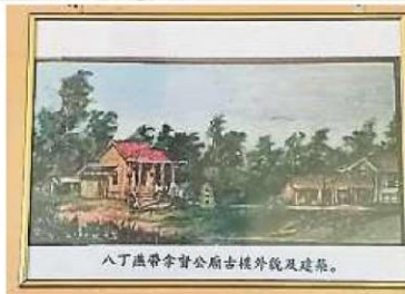
八丁燕带拿督公庙古楼外景及建祭。